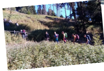
Rifugio Chiusa 25/09/2021