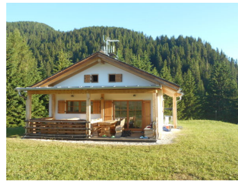
Alpe di Siusi settimana naturalistica 30/06-07/07/2019