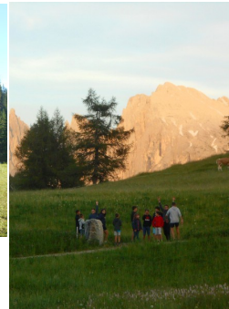
Corno Bianco 04/07/2021