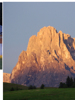
Ale di Siusi settimana naturalistica 01-08/07/2018