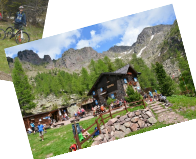
Rifugio Sette Selle 10/06/2018

Il Gruppo Giovanile della sezione del CAI Bolzano (Club Alpino Italiano) organizza per il 2019 un nuovo corso di avvicinamento alla montagna ricco di appuntamenti: alcuni tradizionali, altri nuovi, ma tutti da scoprire. Lo scopo di questo corso rimane quello di cercare di avvicinare i ragazzi alla montagna ed insegnare loro il rispetto per la natura e per l'ambiente che li circonda.