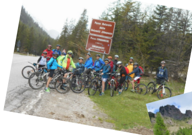
Dobbiaco (bici) 12/05/2018